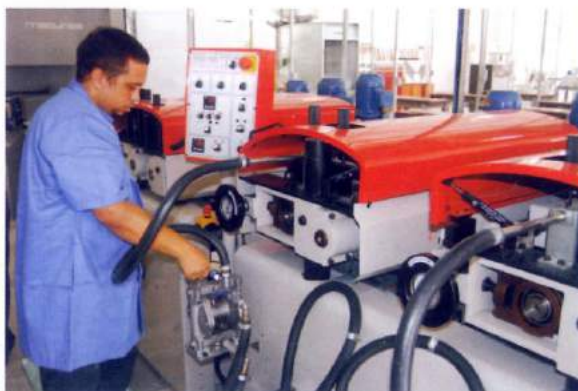
CVT: Centro Vocacional Tecnológico da Indústria Moveleira / Linhares – ES

Para a execução do programa foi firmado a parceria entre FINEP, IEL, SENAI, UFES, IFES, BANDES, FINDES, SECT, FAPES, SEBRAE e CETEM.